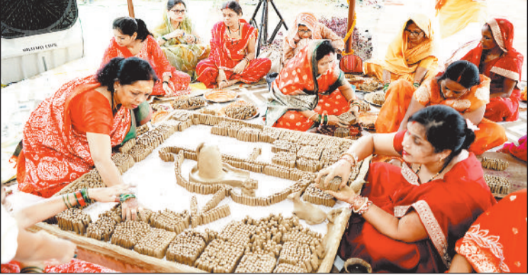
हरिभूमि न्यूज | जशापुरनगर