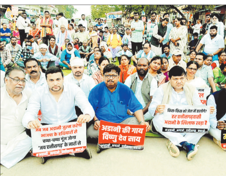
हरिभूमि न्यूज | जशापुरनगर

कांग्रेस ने आज पूरे प्रदेश में नाकेबंदी एवं चक्काजाम दोपहर 12 बजे से 2 बजे के बीच में किया। ईडी के द्वेषपूर्ण कार्रवाई को लेकर प्रदेश कांग्रेस के निर्देश पर जिले में जिला स्तरीय चक्का जाम का कार्यक्रम हुआ। वहीं कांसाबेल में जिला स्तरीय कार्यक्रम रखा गया था जहां जिले के कोने कोने से कांग्रेसी पहुंचकर सरकार पर जमकर बरसे। मुख्य बात यह रही कि कांसाबेल मुख्य चौक एनएच 43 जाम रखा जहां चारों रोड 2 घण्टा तक जाम