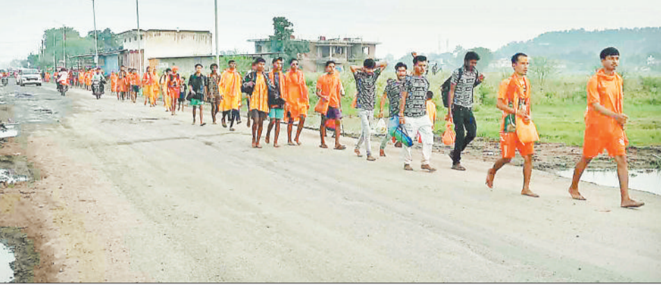
कैलाश गुफा जाते कांवरिए।